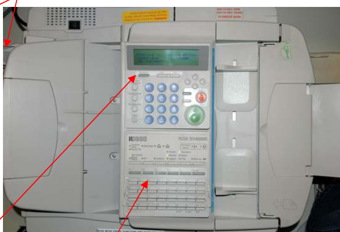
Panneau avant du modèle Ricoh SFX4800MD