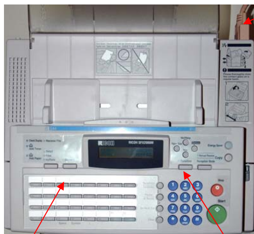
Panneau avant du modèle Ricoh SFX2000M